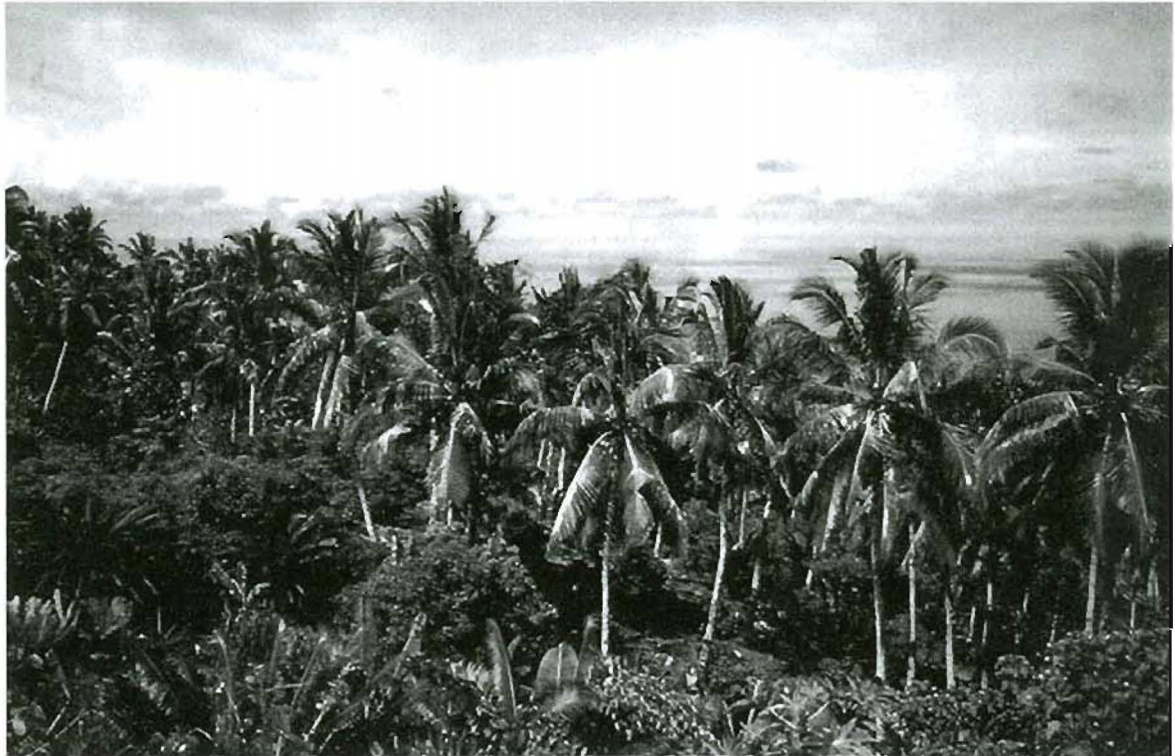
Djiva en redescendant vers l'Est