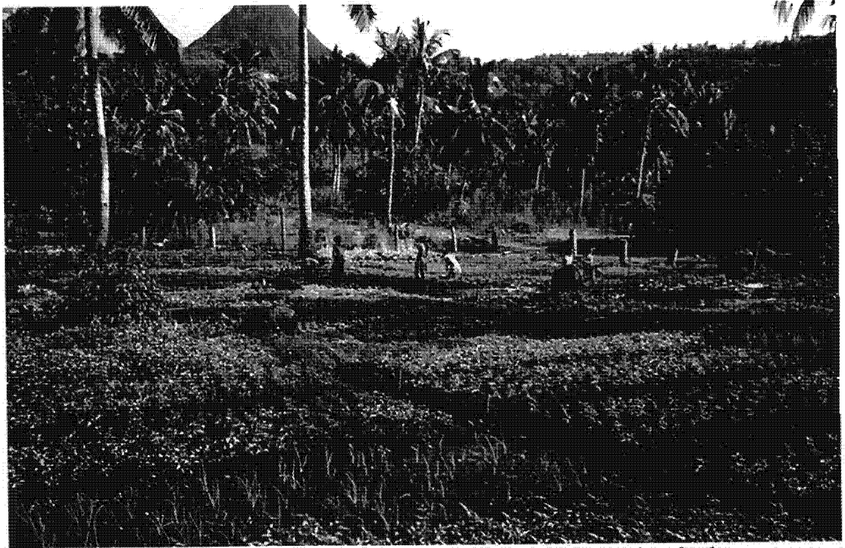
Maraîchage en saison fraîche, avec le Piton du Choungui au fond