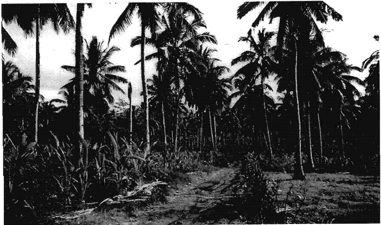
Plantation de cocotiers en forte densité, exportation