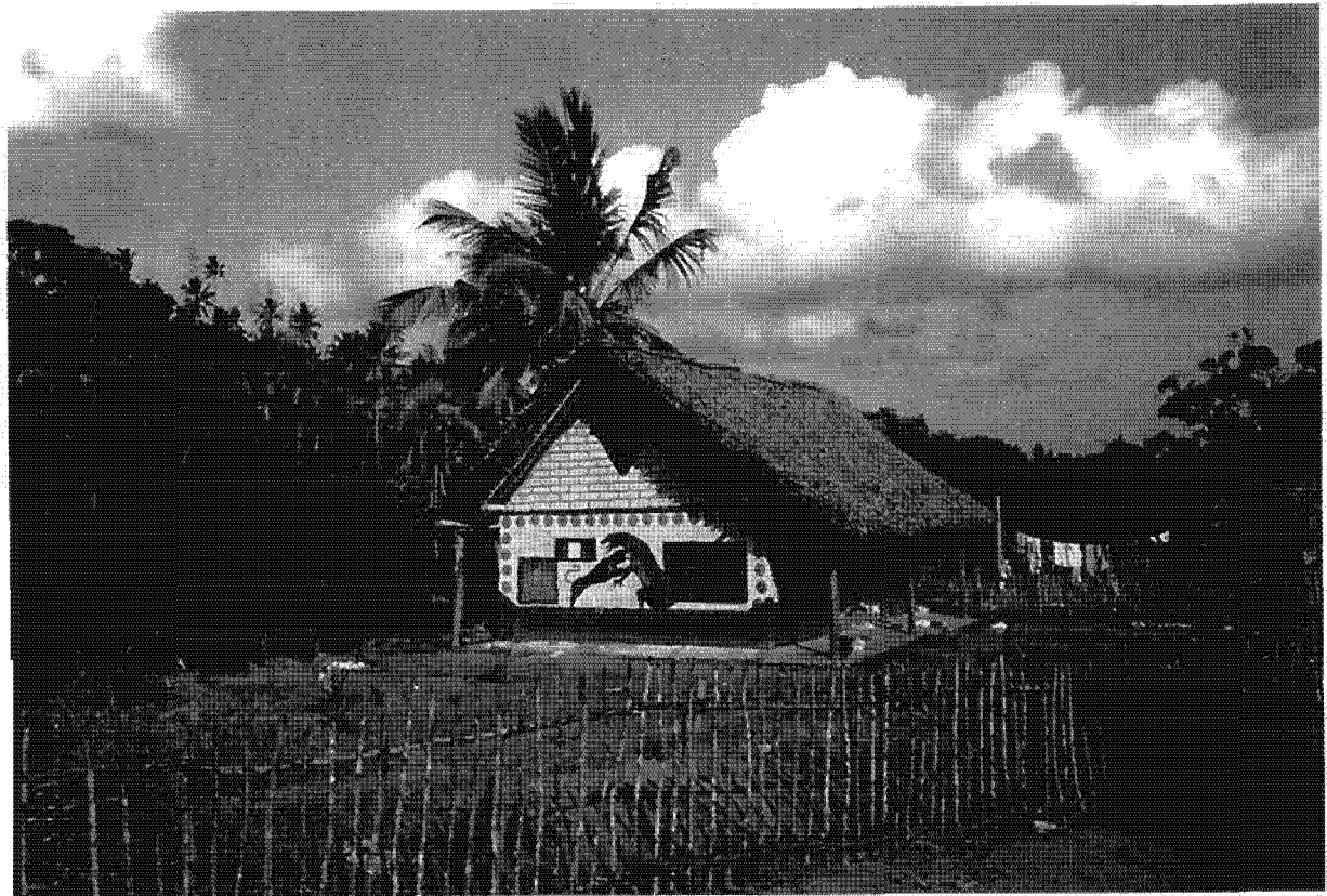
Mbanga, maison traditionnelle des adolescents