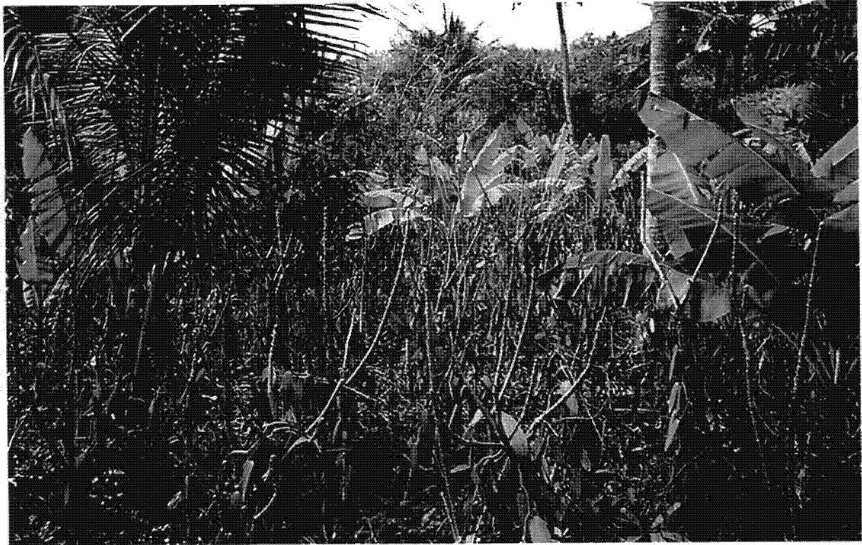
Plantation de Vanille dans le nord de Mayotte (forte densité)