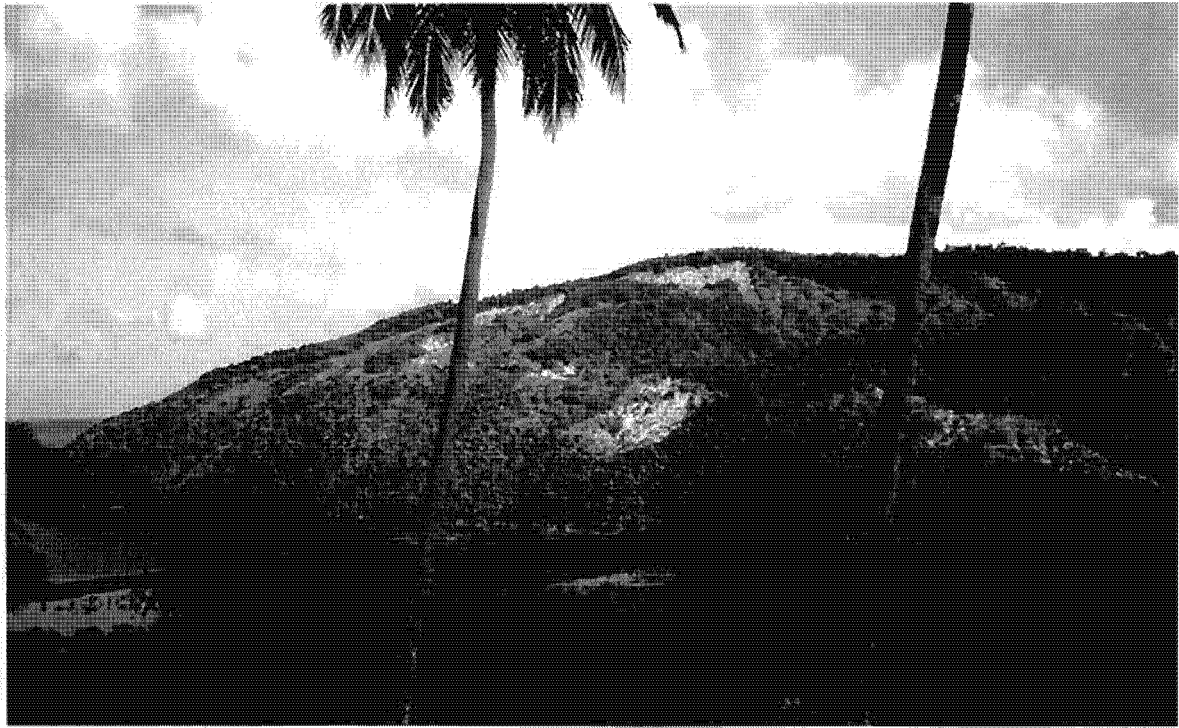
Padzas près de Abawa