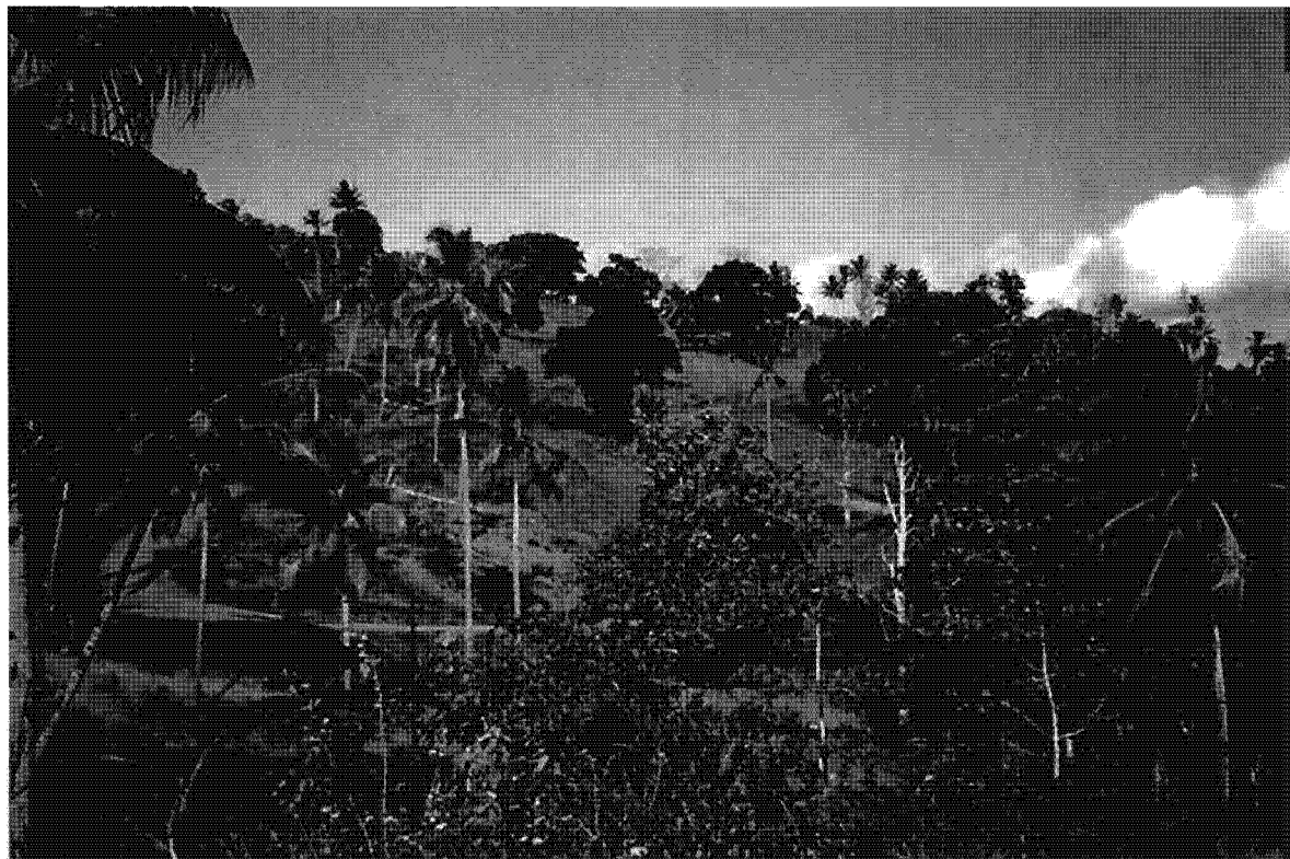
Msamboro – « La Gratte »