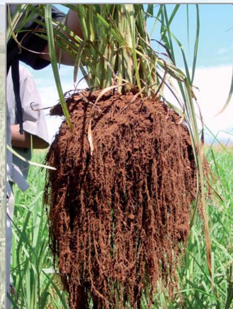
Système racinaire extrêmement puissant d' Eleusine coracana