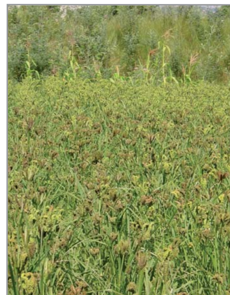
Mélange d' Eleusine coracana

La diffusion de cette espèce s'est cependant faite sous forme d'un mélange de diverses variétés, avec un cycle de 3,5 à 4 mois.