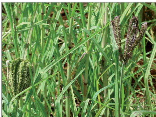
Inflorescences d' Eleusine coracana

Eleusine coracana est originaire d'Afrique de l'Est (Ouganda, Ethiopie) où elle est cultivée depuis l'âge de bronze. L'éleusine est cultivée sur plus de 2,5 millions d'hectares en Asie du Sud et en Afrique de l'Est où elle représente une céréale importante, en particulier en milieu très sec (1)(2)(3).