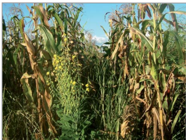
Maïs + Eleusine + Crotalaire