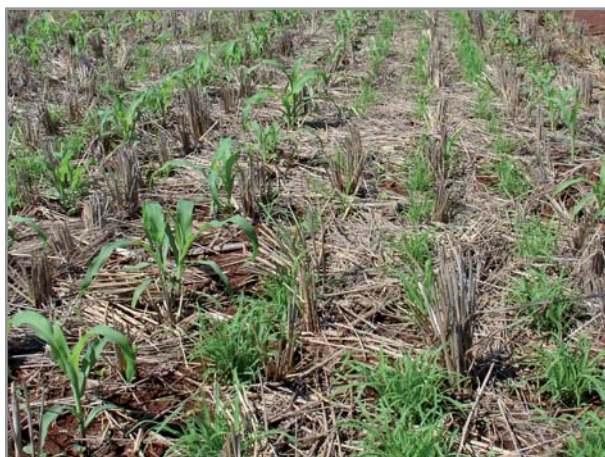
Trois rangs d'éleusine entre les doubles rangs de maïs

Pour un semis du maïs ou du sorgho en rangs simples, espacés de 0,8 à 1 m, deux lignes d'éleusine (espacées d'environ 30 cm) peuvent être installées entre les rangs de maïs.