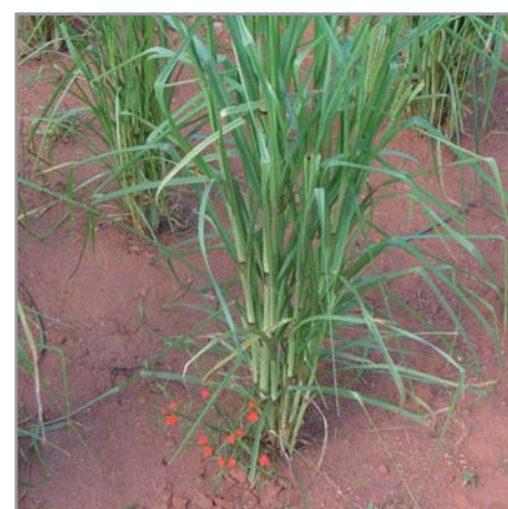
Striga asiatica parasite d' Eleusine coracana