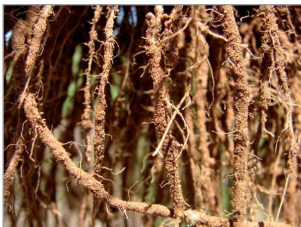
Racines d' Eleusine coracana

Une particularité marquante d' Eleusine coracana est son système racinaire fasciculé, fibreux, exceptionnellement puissant. Eleusine coracana est ainsi très difficile à arracher.