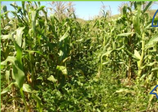
Katsaka sy legiominezy