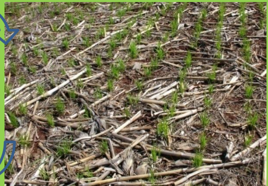
Vary anaty rakotra katsaka sy legiominezy

Katsaka: IRAT 200, CIRAD 412, Mailaka Legiominezy: Voanemba, Antaka, Tsiasisa