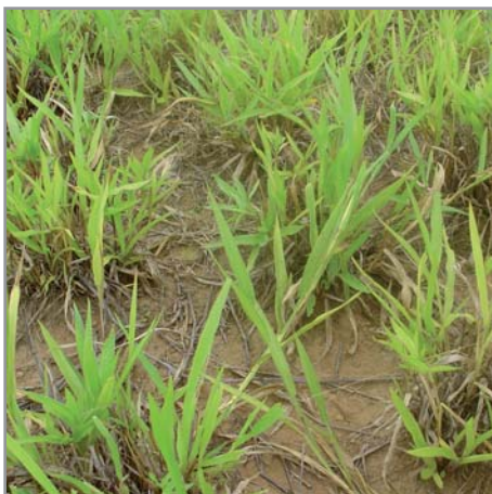
Port en touffes et mauvaise couverture du sol ( B. ruziziensis sans engrais)