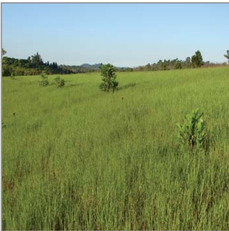
Reprise rapide de B. humidicola après passage de feu

sèche par hectare pour les parties aériennes et 5 t/ha pour les racines) permet d'injecter rapidement du carbone, dans les horizons de surface (en très forte quantité) mais aussi directement en profondeur (où ce carbone sera protégé) grâce aux racines. La structure du sol en est améliorée, durablement.