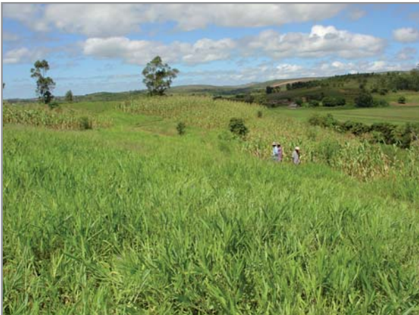
Couverture du sol et contrôle de l'érosion par B. ruziziensis bien développé

Pour la protection des sols (zones de fragilité), en particulier en zones humides, l'espèce B. humidicola (cv Tully) est la plus recommandée pour son système racinaire très dense en surface, sa meilleure couverture du sol, ses capacités de propagation par stolons et sa production de graines plus faible (réduisant les risques de pollution des zones en aval). Elle est cependant de valeur nutritive inférieure aux autres espèces et sera la plus difficile à contrôler à l'herbicide pour remise en culture.