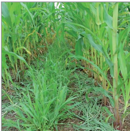
Fauche du brachiaria dans le maïs

* En cas de compétition avec la culture principale (mauvais calage de cycle, faible croissance de la culture sur sol pauvre, etc.), les brachiarias peuvent être fauchés (et éventuellement utilisés pour l'alimentation des animaux).