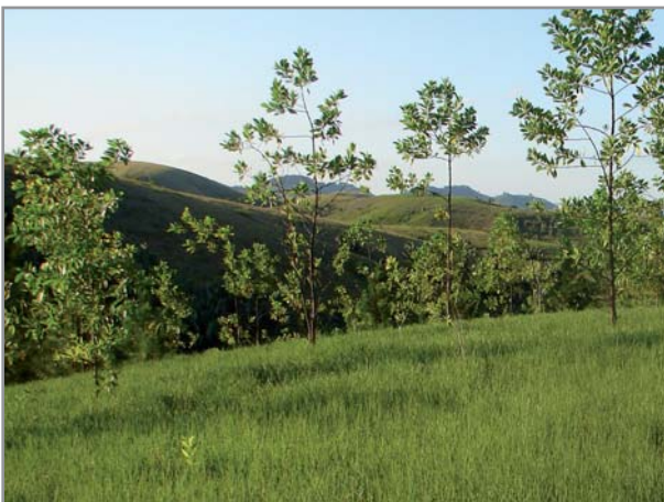
Acacia mangium (3ans) implantés dans B. humidicola . L'arbre profite de la restructuration du sol par le brachiaria, et la graminée bénéficie de l'azote fixé par la légumineuse

Enfin, pour les plantations d'arbres, la mise en place préalable de brachiarias est très intéressante puisque la couverture du sol par le brachiaria est totale (ce qui n'est pas le cas sous une plantation d'arbres sur sol nu), et que les arbres bénéficieront de la restructuration du sol par la graminée. L'implantation d'arbres dans le brachiaria peut se faire soit après traitement localisé (1m 2 environ) à l'herbicide, soit après décapage à l' angady et coupe des racines latérales pour éviter la compétition, le temps que l'arbre développe son système racinaire.