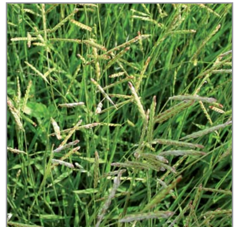
Inflorescences de B. humidicola

Brachiaria humidicola est une graminée, semi-érigée à prostrée, originaire d'Afrique (de l'Éthiopie à l'Afrique du Sud). Les feuilles vert brillant sont glabres ou légèrement pileuses, pointues, lancéolées, faisant 6-15 mm de large et jusqu'à 25 cm de long. Les tiges portant les inflorescences sont érigées, faisant jusqu'à 60 cm de haut. Les inflorescences font 7 à 12 cm de long, supportant 2 à 5 racèmes ressemblant à des épis, espacés sur un axe central. Les racèmes font 2,5 à 5,5 cm, vert clair marqués de