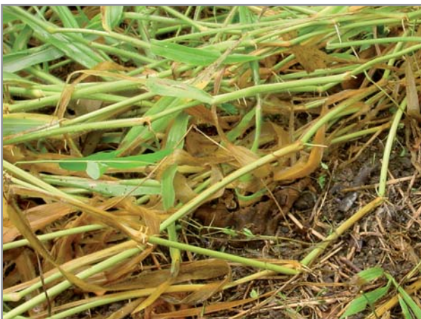
Enracinement de B. ruziziensis au niveau des noeuds