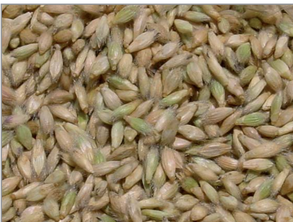
Graines de B. ruziziensis

Dans tous les cas, les semences sont dormantes et doivent