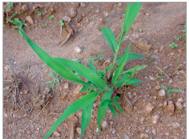
Jeune pousse de B. brizantha

De manière générale, l'implantation du brachiaria par graines peut se