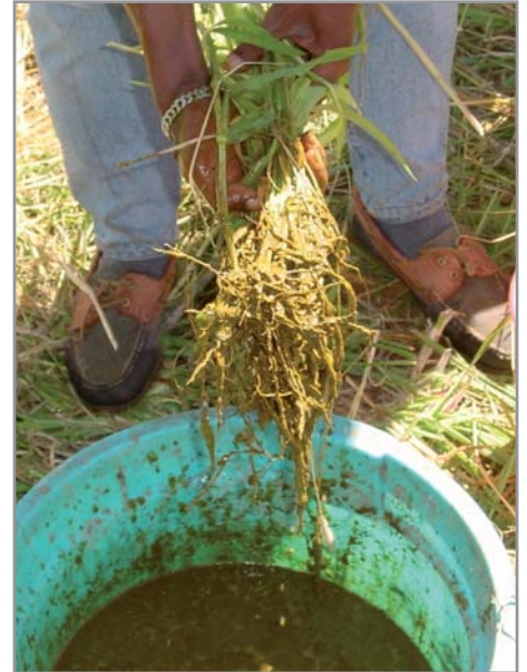
Pralinage des boutures de brachiaria

Dans tous les cas, il est recommandé de gérer de manière raisonnée les brachiarias et de restituer les éléments nutritifs exportés par leur exploitation (tout particulièrement en cas d'exploitation intensive), sous peine de conduire à un épuisement du sol.