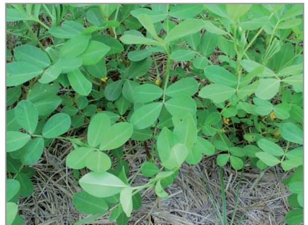
Arachide sur couverture morte de brachiaria

Par leur capacité à restructurer les sols et à contrôler les adventices, les brachiarias sont d'excellents précédents pour toutes les cultures qui exigent une bonne porosité: le riz en particulier bénéficiera largement de ses effets. Cependant, la culture en SCV de céréales dans un paillage de graminée peut fortement souffrir d'une faim d'azote (immobilisation temporaire de l'azote par les bactéries dans les premiers stades de décomposition du paillage), si la couverture n'a pas été contrôlée suffisamment tôt et/ou sans apport d'azote conséquent au semis (50 kg N/ha au semis).