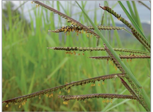
Inflorescences de B. brizantha cv Marandu

Brachiaria brizantha et Brachiaria decumbens sont des graminées, semi-érigées à érigées, originaires d'Afrique (de la Côte d'Ivoire à l'Éthiopie et l'Afrique du Sud pour B. brizantha , d'Afrique centrale pour B. decumbens ). B. brizantha est très étroitement apparenté à B. decumbens et il peut être difficile de les différencier. La principale variété de B. decumbens (cv Basilisk) très largement répandue dans le monde a même été reclassée comme B. brizantha récemment (2) .