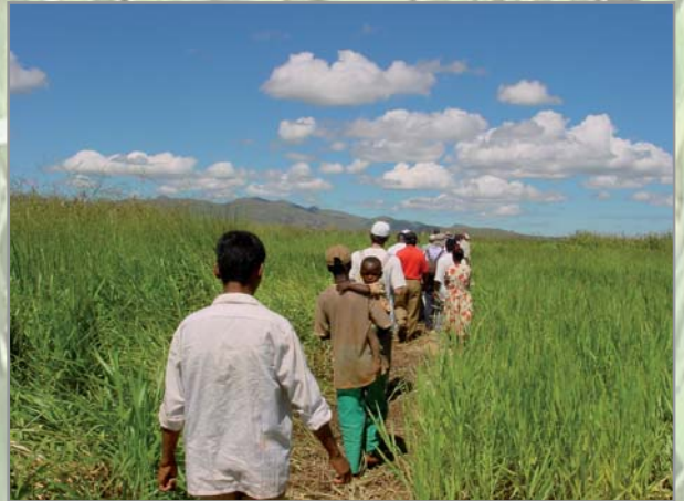
B. brizantha (gauche) et B. ruziziensis (droite)

Des caractéristiques et des aptitudes variables selon les espèces: