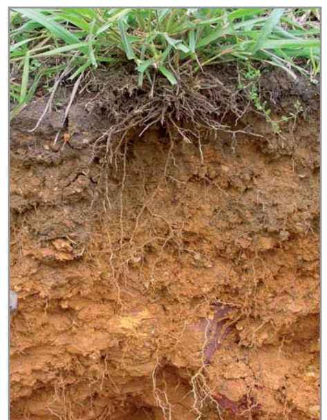
Décompactation du sol par le système racinaire puissant ( B. brizantha )