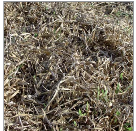
Reprise de B. ruziziensis après un gel modéré