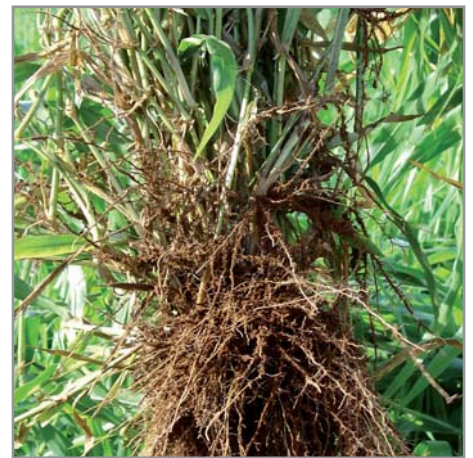
Racines de B. ruziziensis

Son système racinaire fasciculé est composé de nombreuses racines, denses et capables de se développer en profondeur (plus de 1,8 m). Il présente des petits rhizomes. Des pousses repartent à partir des noeuds des tiges rampantes et des stolons qui développent des racines, et des rhizomes. Sa production de biomasse est forte et rapide en saison chaude et humide, mais chute fortement en période froide et/ou sèche. Dans les meilleures conditions, avec une forte fertilisation azotée, elle peut atteindre 25 t/ha de matière sèche pour la biomasse aérienne, en deuxième année quand la production est maximale .