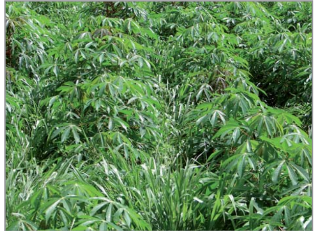
Association Manioc + B. ruziziensis

* En cas de développement insuffisant la première année, il peut être laissé en jachère améliorée (ou pâturage). On peut aussi y implanter du manioc (et même du maïs en altitude où le brachiaria se développe plus lentement), en le contrôlant simplement (par fauchage). Cela permettra au brachiaria de se développer et de produire une forte biomasse tout en produisant des grains ou des tubercules et donc sans immobiliser la terre pendant une saison.