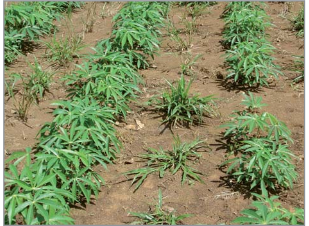
Semis de brachiaria dans la culture de manioc

Pour le manioc, qui est planté en général en fin de saison des pluies, il est préférable d'implanter le brachiaria en début de saison des pluies suivantes, ce qui permet un bon démarrage de la graminée, sans risque de compétition (en particulier pour l'eau) durant la saison sèche. Dans le sud-est malgache où le manioc est généralement implanté en période peu humide (septembre-octobre), l'implantation du brachiaria se fait de préférence au mois d'avril-mai.