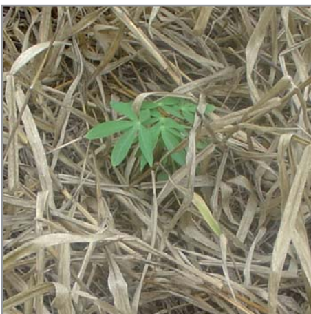
Manioc sur couverture de B. ruziziensis

Le plus facile à contrôler est B. ruziziensis , pour lequel 1080 g/ha de matière active sont suffisants à condition de l'appliquer dans de bonnes conditions: pas pendant les grosses chaleurs, eau à pH 4 à 6 (pas d'eau basique qui réduit fortement l'efficacité du produit), brachiaria en période végétative active, etc. Les autres brachiarias nécessiteront 1800 à 2160 g/ha de glyphosate, B. humidicola étant le plus difficile à maîtriser correctement. Le traitement séquentiel (deux passages d'herbicide, à une semaine d'intervalle environ: 1/2 dose au premier passage et dose inférieure à la 1/2 dose au deuxième passage) permet d'accroître l'efficacité de l'herbicide et de réduire la dose totale utilisée. Comme le traitement en deux passages croisés, il permet également de s'assurer que l'ensemble de la parcelle a été traité de manière homogène.