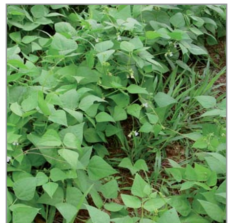
Bouturage de brachiaria dans le haricot

Bien que n'étant pas des légumineuses, leur association avec des bactéries libres fixatrices d'azote leur permet de fixer jusqu'à 50 unités N/ha/an, quantité non négligeable.