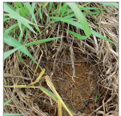
Recharge en carbone et restructuration du sol sous B. ruziziensis

Un des principaux intérêts de ces 4 espèces de brachiaria est qu'elles sont capables de remobiliser rapidement de la fertilité au profit des cultures, en particulier sur des sols ferallitiques acides fortement désaturés et plus ou moins dégradés. Ces sols représentent dans le monde tropical des dizaines de millions d'hectares défrichés mais qui sont inexploitablement avec travail du sol sans apports massifs