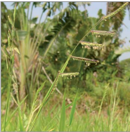
Inflorescences de B. ruziziensis

Les brachiarias sont des graminées (Famille des Poaceae ) pérennes herbacées de type C4, originaires d'Afrique mais très largement répandues dans le monde inter-tropical. Les différentes espèces présentées ici produisent toutes une forte biomasse (fourrage de qualité), sont capables de supprimer les adventices et ont un système racinaire puissant et profond, capable de décompacter les sols, de les restructurer, d'injecter du carbone en profondeur et de recycler efficacement les nutriments lixiviés (rôle de "pompe biologique").