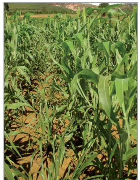
Semis de brachiaria dans la culture de maïs