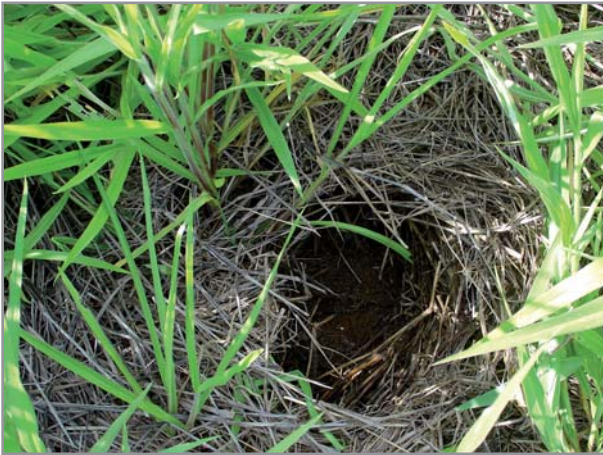
Protection et restructuration du sol

Les aptitudes agronomiques des brachiarias en font des plantes très intéressantes sur le plan environnemental. Ils permettent :