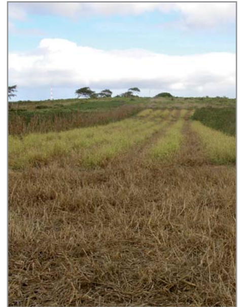
Contrôle du brachiaria au glyphosate sur toute la surface (premier plan) et en bandes alternées (au fond).

Dans le cas de cultures semées à faible densité, avec un espacement important entre deux lignes (maïs, manioc), il est possible de traiter le brachiaria à l'herbicide en bandes (40 à 50 cm traités et 40 à 50 cm non traités), ce qui réduit la dose à l'hectare de moitié. Cette technique présente aussi l'avantage de permettre une recolonisation par le brachiaria à partir des bandes non traitées, sans avoir besoin de ressemer une plante de couverture.