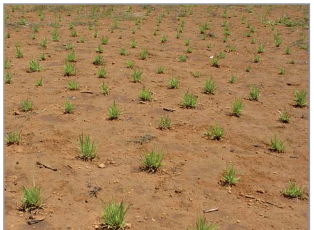
Semis de brachiaria en pur sur sol très dégradé

L'espacement entre poquets recommandé est de 30 à 40 cm sur la ligne, l'espacement entre lignes variant en fonction de la plante associée (cf. fiches techniques par système). En culture pure, l'espacement entre lignes recommandé est aussi de 30 à 40 cm, ce qui permet une couverture relativement rapide et homogène du sol. A ces densités, la quantité de semences nécessaire est de 3 à 7 kg./ha.