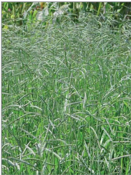
Inflorescences de B. decumbens

B. brizantha se développe plus en touffes que B. decumbens qui s'étale plus et forme une couverture très dense. La forme de leur rachis, l'arrangement et la texture de leurs épillets diffèrent légèrement (1) . Ils se développent en larges touffes (1 m à 1,5 m de haut et jusqu'à 2 m pour B. brizantha ) qui s'étalent si la plante n'est pas coupée. Les feuilles vert foncé sont glabres ou légèrement velues et font jusqu'à 100 cm de long, pour 1,5 à 2 cm de large pour B. brizantha alors qu'elles sont plus petites (25 cm) pour B. decumbens . Les inflorescences sont des panicules composées de 2 à 7 racèmes ( B. decumbens , jusqu'à 16 racèmes pour B. brizantha ), relativement longs (4 à 20 cm), portant des épillets elliptiques, glabres, faisant 4 à 6 mm de long. Ces épillets sont arrangés en doubles rangs chez B. decumbens alors qu'ils sont sur un seul rang pour B. brizantha (1) . Le poids de 1000 graines est d'environ 3,6 grammes pour B. decumbens (1) . Les semences ont un taux de dormance très élevé après la récolte qui peut perdurer 6 mois, les semences restant viables jusqu'à trois ans (1)(2) . La