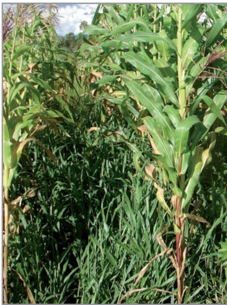
Association Maïs + Brachiaria

tiquée avec succès pour l'installation de pâturage. Le brachiaria doit alors être associé à un riz de cycle très court (90-100 jours) qui est implanté en semis simultané ou décalé de 20 jours. Ces systèmes appelés "Barreirão" ou "Santa Fé" dans le centre du Brésil permettent de pratiquer un élevage bovin plus intensif, le riz servant à couvrir les frais d'implantation et/ou de rénovation du pâturage pour 4 à 5 ans d'exploitation.