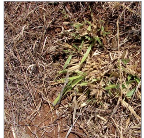
Affaiblissement de B. brizantha par fauche trop fréquente et trop rase.

Pour un rôle de décompactation rapide des sols, B. brizantha (cv Marandu), B. decumbens (cv Basilisk) et B. humidicola (cv Tully) ont les systèmes racinaires les plus puissants. La gestion des cultures en SCV est cependant plus facile avec B. ruziziensis (cv Ruzi importé du Brésil), contrôlable chimiquement à moindre coût que les autres brachiarias ( B. humidicola étant le plus difficile à maîtriser est recommandé surtout pour la protection de zones fragiles). Sur des sols moyennement compactés, et que l'on veut remettre en culture régulièrement, l'emploi du B. ruziziensis est préférable. Si la place est disponible, il est possible de le conserver deux ou trois ans pour une bonne restructuration des sols avant remise en culture. On évitera cependant de le laisser grainer.