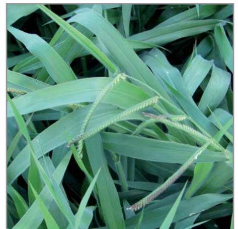
Brachiaria hybride cv "mulato"

Le brachiaria hybride ( B. brizantha cv marandu x B. ruziziensis ) cv "mulato" est intéressant pour sa forte production de biomasse (aérienne et racinaire) de 10 à 25% plus élevée que B. brizantha , sa qualité fourragère, sa capacité