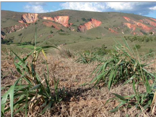
Implantation de B. brizantha par éclats de souches sur sol dégradé

En culture pure il est souvent difficile de le semer tôt, les paysans préférant à juste titre terminer l'implantation des cultures avant de semer une plante de couverture/fourrage. Il est donc recommandé de semer dès que possible (dès les premières pluies utiles voire même en sec avant les pluies), et dans tous les cas avant le 15 janvier sur les hautes terres où son développement est lent (jusqu'à fin janvier si on utilise des boutures dont le démarrage est plus rapide), avant le 31 décembre en milieu semi-aride pour qu'il puisse suffisamment se développer avant l'arrêt des pluies, et avant le 15 février en zone de moyenne altitude avec longue saison sèche. En zone tropicale humide, l'implantation peut se faire durant toute l'année, en évitant cependant les périodes climatiques à pluviométrie la plus aléatoire.