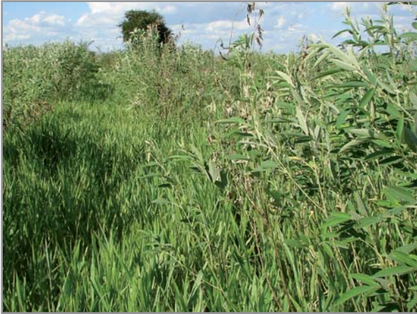
Association B. brizantha + Cajanus cajan

B. humidicola , par sa très forte production de biomasse et son port, couvre fortement le sol. Elle est l'espèce la plus difficile à associer, alors que les associations avec B. brizantha et B. ruziziensis sont relativement faciles.