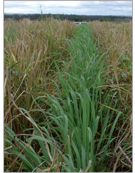
Croissance rapide du brachiaria après la récolte du riz

Ils peuvent ainsi être associés à des cultures comme le riz ou surtout le maïs sur des sols riches ou fertilisés, ou du manioc sur des sols pauvres. L'association manioc + brachiaria par exemple, bien gérée, bénéficie très fortement au manioc et permet de doubler ou tripler les rendements par rapport à la culture pure du manioc dans les régions où la pluviométrie supérieure à 800 mm/an n'est pas un facteur limitant. L'association riz + B. ruziziensis peut être pra-