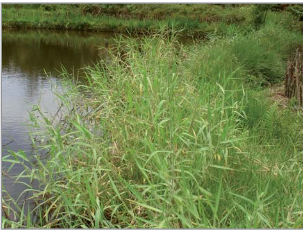
B. humidicola et B. mutica en bordure de bassin

Ils répondent tous très bien à la fertilisation (P et N en particulier) mais sont capables de se développer sur des sols de faible fertilité, en particulier B. humidicola qui est capable d'extraire le phosphore et le calcium à des niveaux de concentration très faibles dans le sol. Sur des sols très dégradés, B. humidicola a toutefois du mal à supporter une longue saison sèche (préférer alors B. brizantha ).