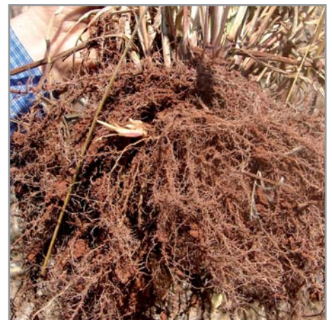
Système racinaire puissant de B. brizantha , avec rhizomes

Le fort pouvoir de restructuration et d'aération du sol et la sécrétion d'exudats racinaires permettent de relancer l'activité biologique et de