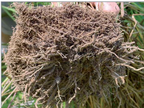
Système racinaire très dense et puissant de B. humidicola

pourpre. Les épillets font 4,5 à 5,5 mm de long, également verts et pourpres. Le poids de 1000 graines est d'environ 5 grammes (1) . La production de semence est très limitée à basse altitude ou latitude. En revanche, elle est excellente sur les hautes terres malgaches. Les semences peuvent être dormantes pendant 9 mois (1) .