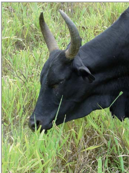
Pâturage de B. ruziziensis

Les brachiarias sont de bons fourrages, avec cependant des différences entre espèces :