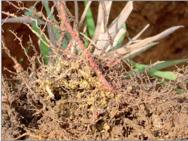
Développement de mycorhizes associées aux racines de B. brizantha

favoriser le développement de champignons type mycorhizes, associés aux racines.