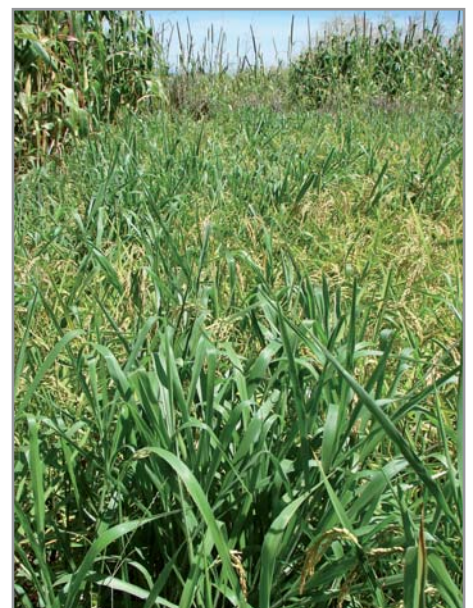
Repousses mal contrôlées de graines de brachiaria dans le riz

* Dans les zones à longue saison sèche, le contrôle du brachiaria à l'herbicide nécessite d'attendre la reprise de la végétation après les premières pluies pour pouvoir traiter de façon efficace, ce qui retarde le semis. Il est dans ces conditions préférable de traiter en végétation à la fin du cycle précédent, en saison des pluies. Cette pratique a l'avantage de réduire les risques de faim d'azote en début de cycle, mais demande un investissement en herbicide plusieurs mois avant la mise en culture, souvent difficile à réaliser à Madagascar.