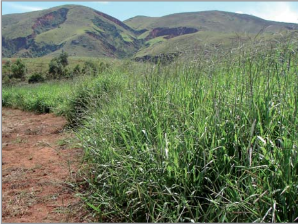
Forte production de biomasse sur sol dégradé (B.brizantha cv Marandu)

sèche par hectare pour les parties aériennes et 5 t/ha pour les racines) permet d'injecter rapidement du carbone, dans les horizons de surface (en très forte quantité) mais aussi directement en profondeur (où ce carbone sera protégé) grâce aux racines. La structure du sol en est améliorée, durablement.