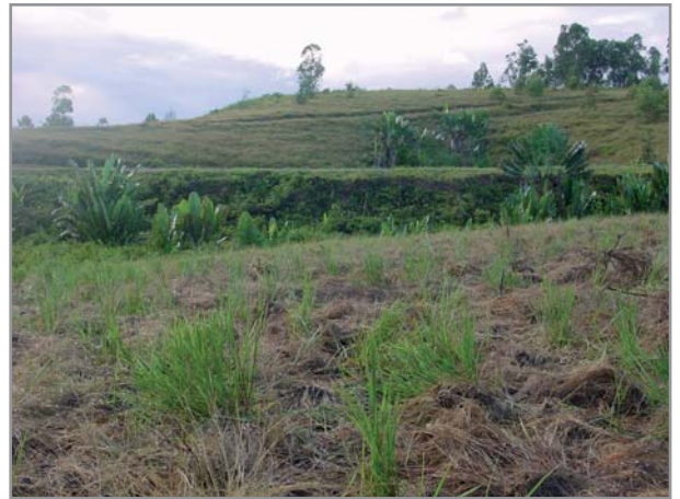
Décapage du bozaka après reprise du B. humidicola implanté à 1m x 1m.

B. humidicola dont la production de semences est plus difficile (mis à part en altitude) s'implante de préférence par boutures ou éclats de souches, d'autant plus que sa forte capacité à se propager par stolons et rhizomes permet de l'implanter avec un espacement de 1m x 1m. L'implantation dans le bozaka ( Aristida sp. , Imperata sp. , etc.) peut se faire après un décapage à l'angady (ou herbicidage) limité dans un premier temps aux emplacements où les boutures vont être implantées, espacées de 1m x 1m. Après reprise du brachiaria, la végétation restante peut alors être progressivement décapée à l'angady, permettant la colonisation par B. humidicola . Cette technique a l'avantage d'éviter l'érosion favorisée en cas d'implantation après labour.