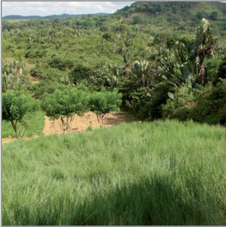
Forte production de biomasse et couverture du sol par B. humidicola