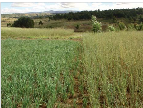
Avoine de saison intermédiaire en végétation et avoine de premier cycle en cours de maturation sur les Hautes Terres

* dès les premières pluies (en octobre - novembre) pour une utilisation en couverture végétale en février-mars, après floraison