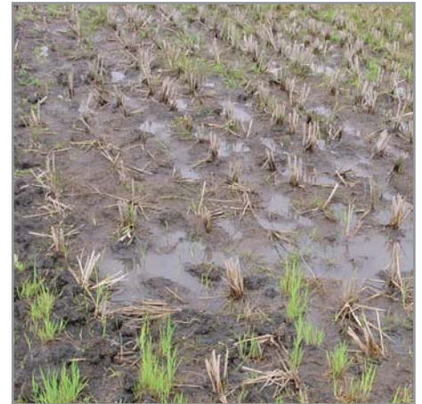
Mort de l'avoine sur sol engorgé

Enfin, l'avoine se développe assez mal sous ombrage, dans les associations trop denses.