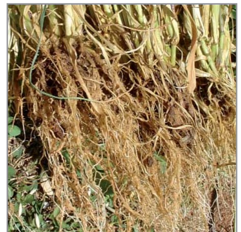
Système racinaire fasciculé de l'avoine