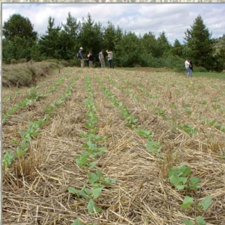
Haricot sur couverture d'avoine