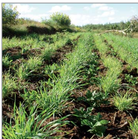
Avoine et pomme de terre

De manière générale, le traitement de semence n'est pas nécessaire pour l'avoine.