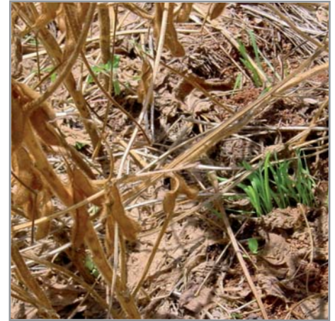
Avoine semée en dérobé dans le soja