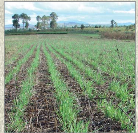
Avoine après haricot