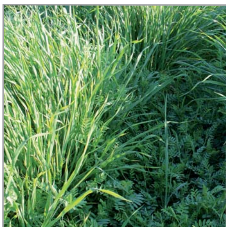
Mélange Avoine + vesce

L'association avec des plantes de couverture en mélange se fait avec des plantes érigées de taille inférieure ou comparable à l'avoine (ray-grass, radis fourrager, lupin blanc) ou des plantes non dressées comme le petit pois ou la vesce. Il est aussi possible d'associer l'avoine avec des plantes qui s'implantent plus lentement ( Brachiaria ). Il est très intéressant d'associer l'avoine afin de constituer une couverture multifonctionnelle. Le mélange avec de la vesce, du lupin blanc et du radis fourrager par exemple permet d'assurer les fonctions de restructuration du sol, de contrôle des adventices et des bioagresseurs, et d'amélioration de la fertilité par fixation d'azote.