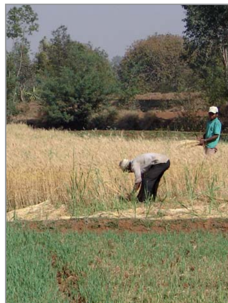
Fauche de l'avoine

Le semis de la culture dans la couverture d'avoine se fait en déplaçant la paille le moins possible. Il suffit d'ouvrir un petit trou pour mettre les graines dans le sol, sans remonter de terre au dessus de la paille. Il faut s'assurer de bien localiser les semences dans le sol et non en surface, dans la couverture, surtout si cette couverture est très importante et que le mulch n'est pas encore tassé. Ce semis peut se faire simplement avec une petite angady ou un bâton, ou encore avec une canne planteuse, une roue semeuse ou un semoir mécanisé (qui ouvre alors un petit sillon dans la couverture végétale).