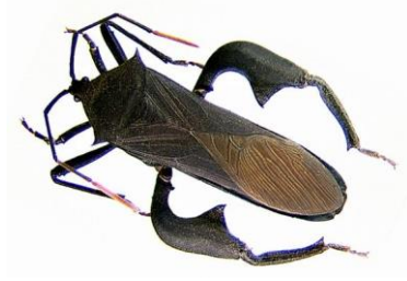
Photo : Adulte d' Anoplocnemis