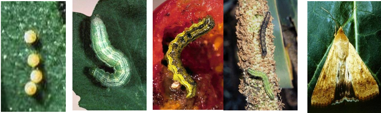
Photo de Helicoverpa armigera (de gauche à droite) : Œufs, jeune larve, larve âgée, adulte.