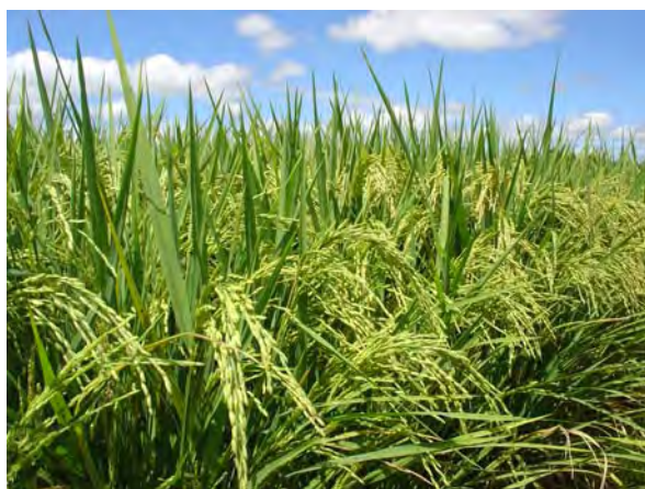
SEBOTA 68 (100-105 jours au Lac Alaotra)

Cette durée de cycle, qui s'allonge lorsque l'on monte en altitude, fait que les variétés actuellement disponibles ne sont bien adaptées que pour les zones inférieures à 900-1000 mètres d'altitude. Au-delà de 1000 m, ces variétés ne peuvent être utilisées qu'avec un semis extrêmement précoce (octobre au plus tard) car le cycle s'allongeant, elles risquent d'arriver à floraison à un moment où les basses températures entraîneront une forte stérilité, ce problème se présentant de manière d'autant plus marqué que l'altitude est élevée.